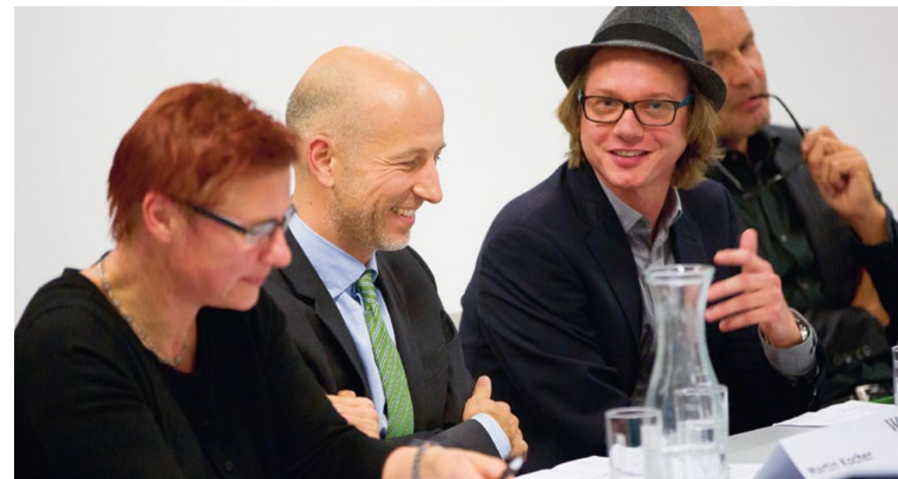
WU-Lecture 2016: Podiumsdiskussion zu Forschungsinstitutionen zwischen akademischer Exzellenz und politischer Relevanz