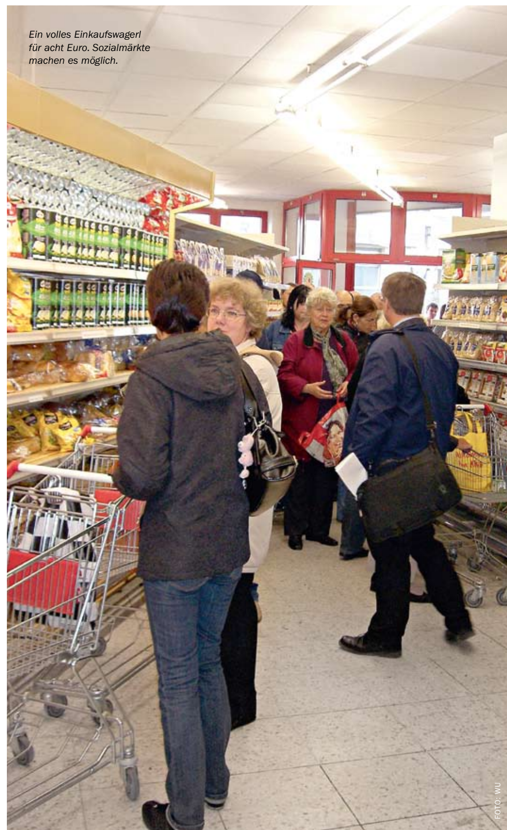
Ein volles Einkaufswagen für acht Euro. Sozialmärkte machen es möglich.