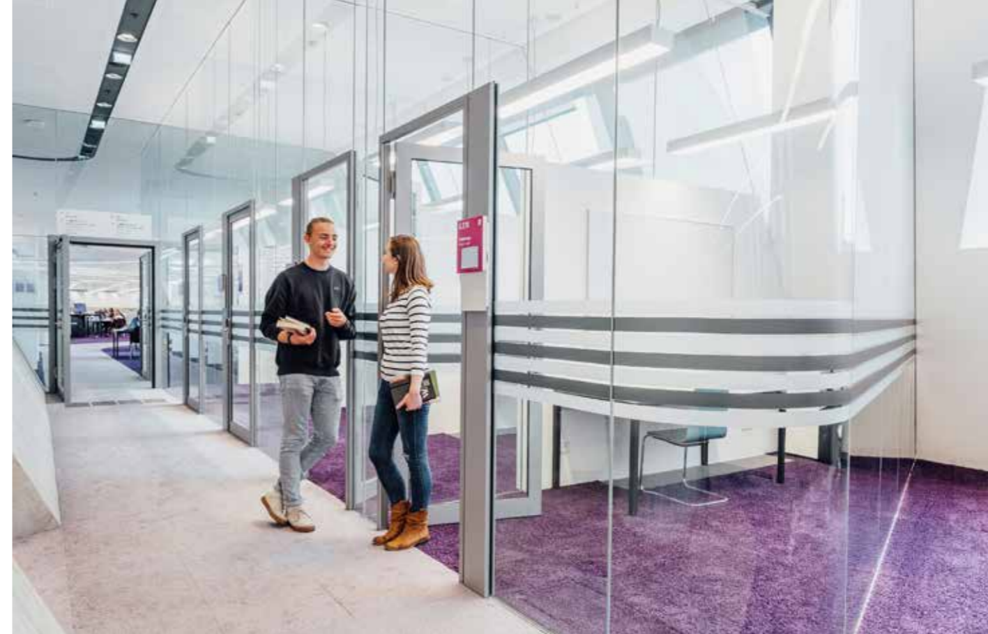
BEISPIEL EINES CARRELS IM LEARNING CENTER (LC)